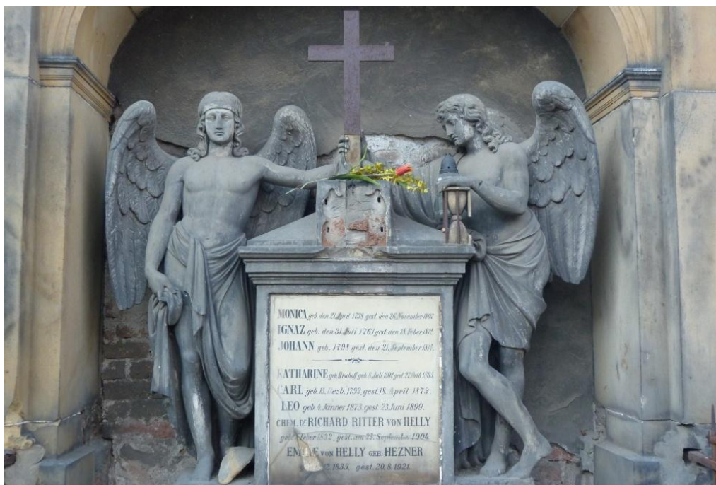
Hrobka rodiny von Helly na Olšanských hřbitovech v Praze. Stav z března 2012.

Na rodinné hrobce von Helly v Praze na Olšanských hřbitovech jsou pohřbeni tito příslušníci rodu. Poznámka kurzívou upřesňuje vztah k zájmovému Alexanderu von Helly: